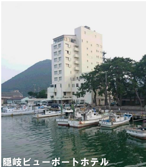
隠岐ビューポートホテル