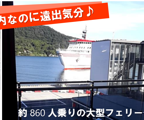
約 860 人乗りの大型フェリー